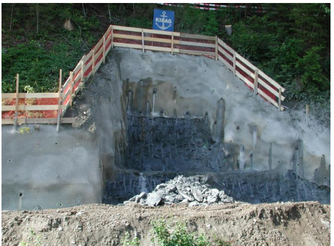
KW 27 / RHB Brand / Hangsicherung links