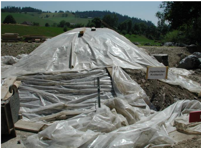
KW 21 / RHB Brand / Triage Bauaushub