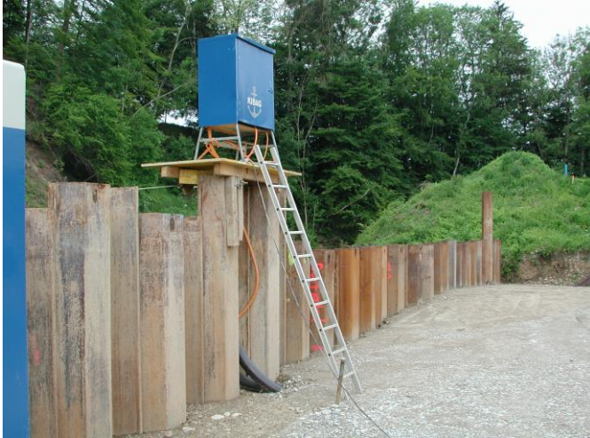
KW 21 / RHB Brand / Spundwand rechts