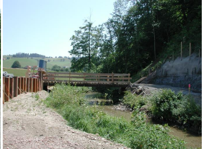
KW 21 / RHB Brand / Behelfsbrücke über Langete