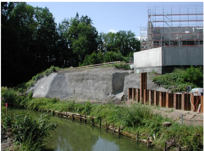
KW 27 / RHB Brand / Hangsicherung rechts