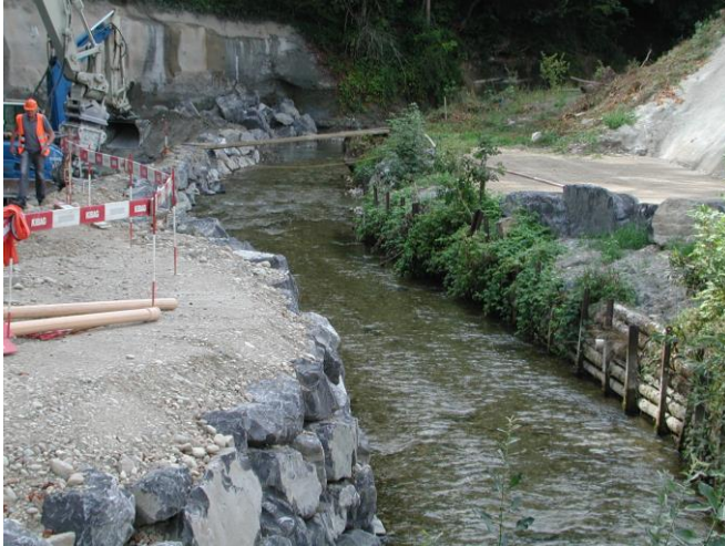
KW 34 / RHB Brand / Langete vor Umlegung