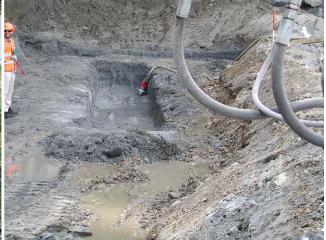
KW 34 / RHB Brand / Vorbereiten Spundwände links für Umlegung der Langete