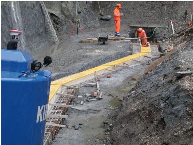
KW 35 / RHB Brand / Vorbereiten Spundwände links