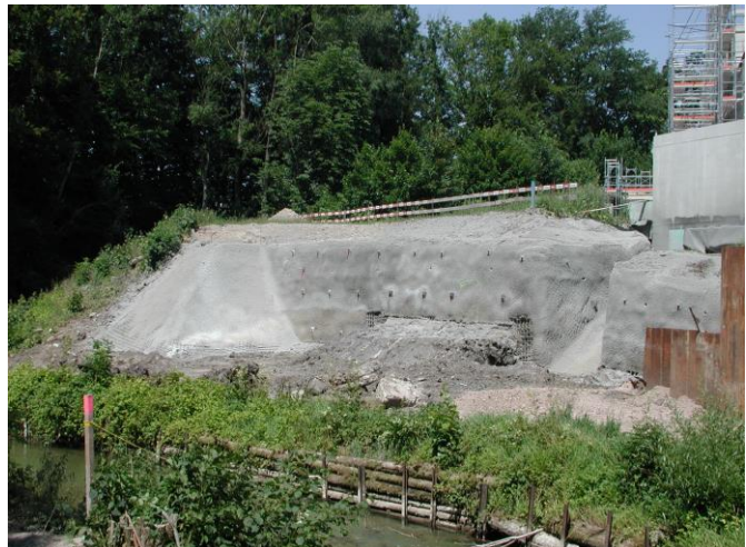
KW 21 / RHB Brand / Hangsicherung rechts